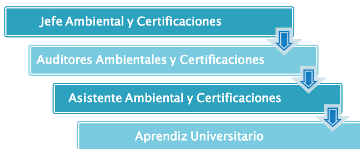
Figura 1. Organigrama departamento ambiental y certificaciones

En la actualidad, la empresa C.I. Tecbaco S.A. cuenta con un departamento ambiental, en los términos establecidos en el decreto nacional No.1299 del 22 de abril de 2008. Este departamento se encuentra inscrito ante el DADSA. Este equipo se encuentra conformado como se detalla a continuación y será el encargado de la implementación de este plan.