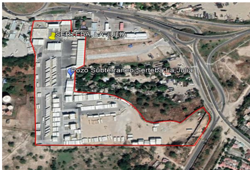
Imagen 1. Ubicación Patio la Julia-Sertebe S.A