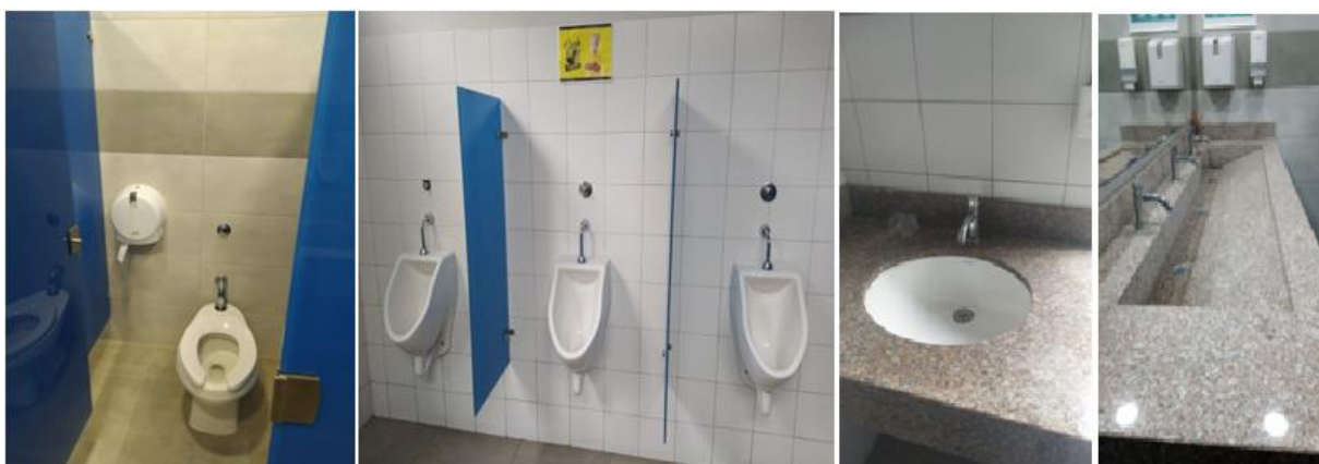
Imagen 3. Evidencia fotográfica de la infraestructura sanitaria.

En la Tabla anterior, se presenta los elementos instalados en el Patio la Julia-Sertebe S.A. de C.I. Tecbaco S.A. de los cuales se abastecen del pozo de agua subterránea, en ella se observan que la mayoría de los dispositivos no son ahorradores de agua. Por lo que el compromiso de la empresa se enmarcará en la optimización y buen manejo de estos elementos, de tal forma que se contribuya al cuidado y preservación del recurso.